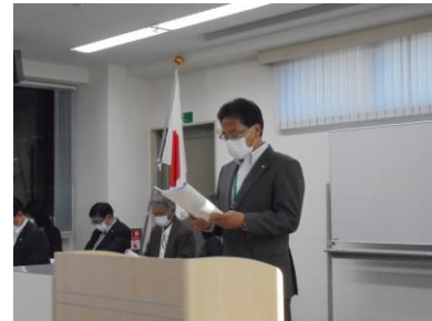
【管理部・指針書委員会所信:内堀部長】