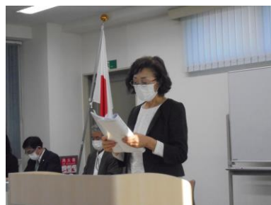
【営業部・連携推進委員会所信:太田次長】