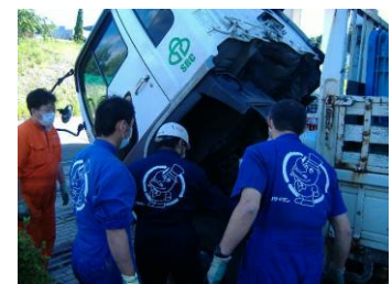
仙南事業部一斉車両点検